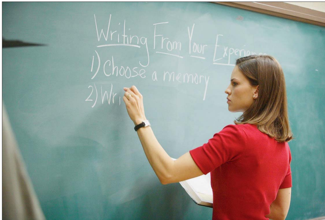
ÉCRIRE POUR EXISTER Hilary Swank joue les maîtresses d'école.

Elle parle du rapport vivant et sensible de l'homme avec son monde. Que ce monde soit celui d'hier ou celui de demain. Le sens de ces polyphonies subtiles est transmis par l'émotion qu'elles dégagent. Car cette musique se veut profondément sincère et, par là même, proche de son public. /comm